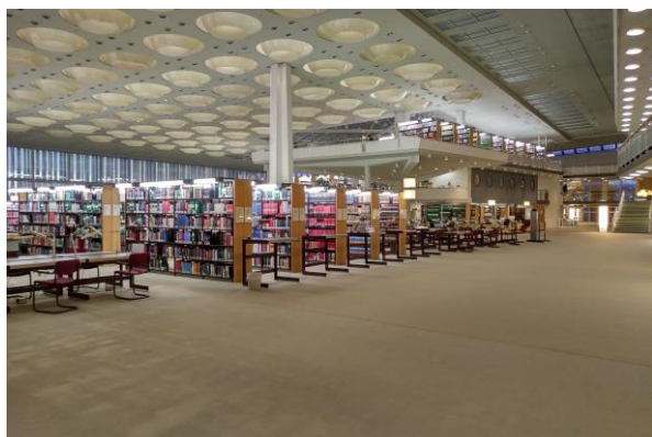
Blick in den Lesesaal