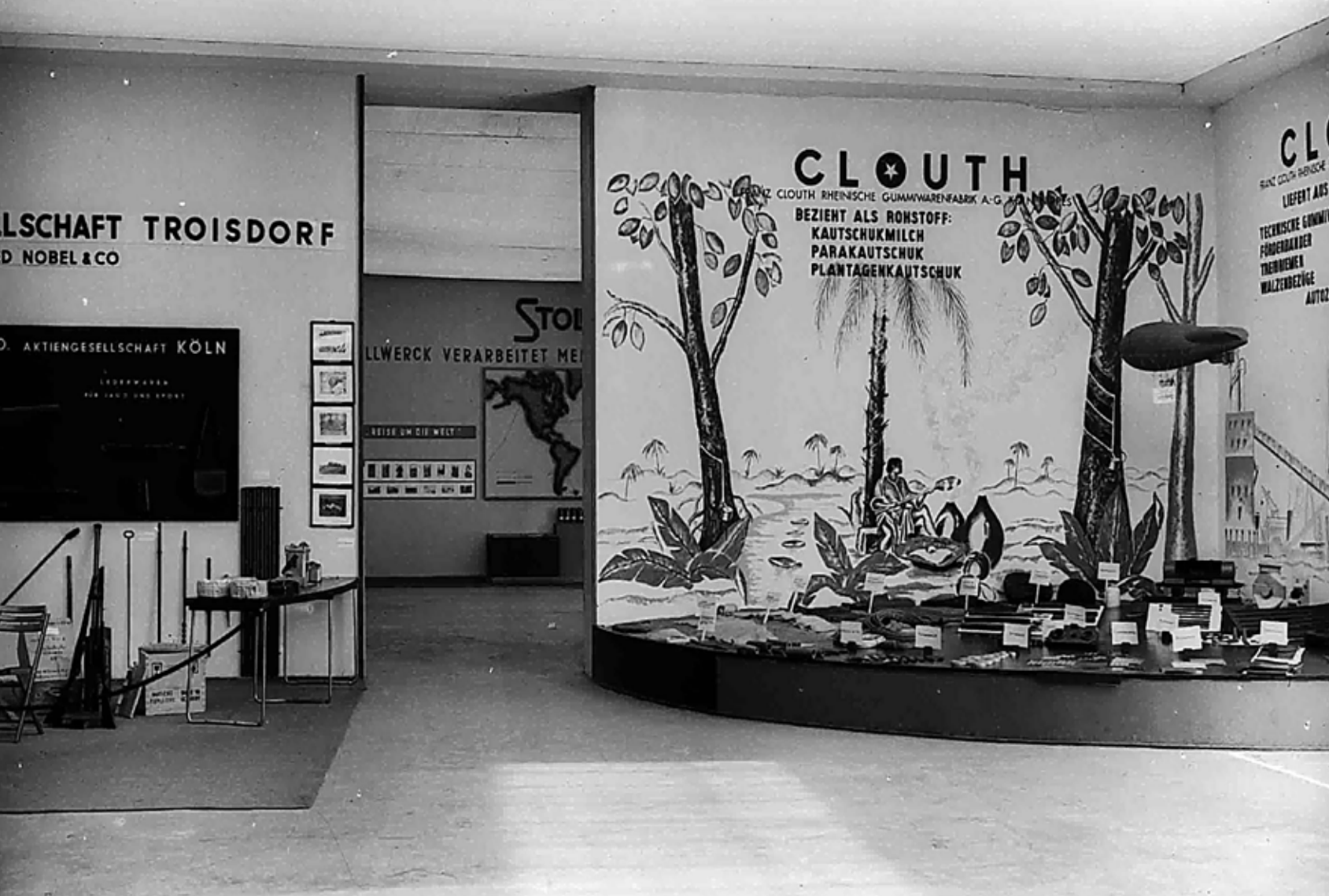
Kolonialausstellung 1934 in Köln

Margrit Schulte Beerbühl: Zigarren für Europa: Ein Bielefelder Unternehmen auf Kuba (ca. 1840-1921)