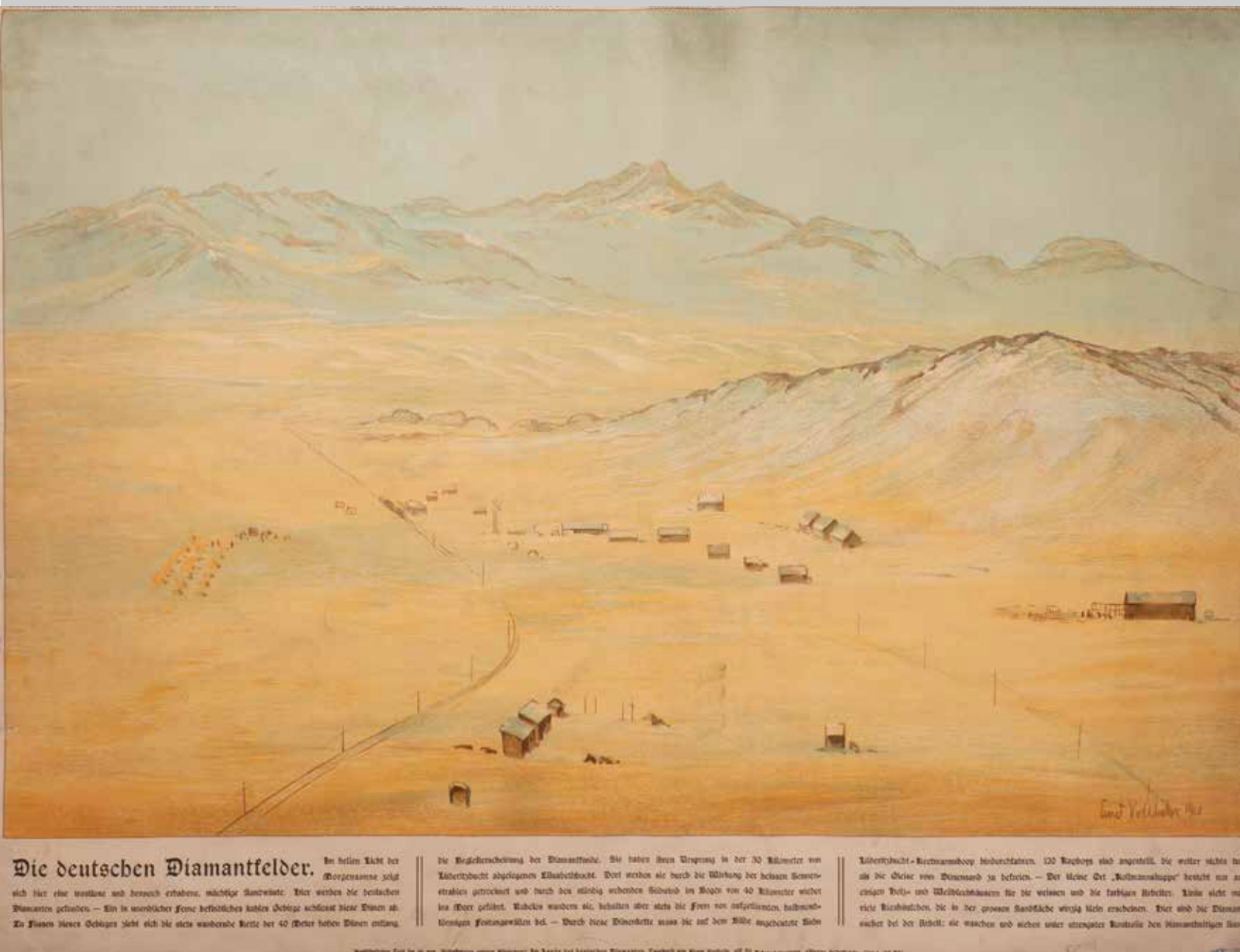
Ernst Vollbehrl, Schulwandbild „Die deutschen Diamantfelder“, 1910

Der heutige politische Raum Nordrhein-Westfalen wird durch eine ausdifferenzierte Landesgeschichtsschreibung und eine lebendige regionale Geschichtslandschaft geprägt. Welchen Stellenwert hatte bislang die imperiale und koloniale Vergangenheit darin?