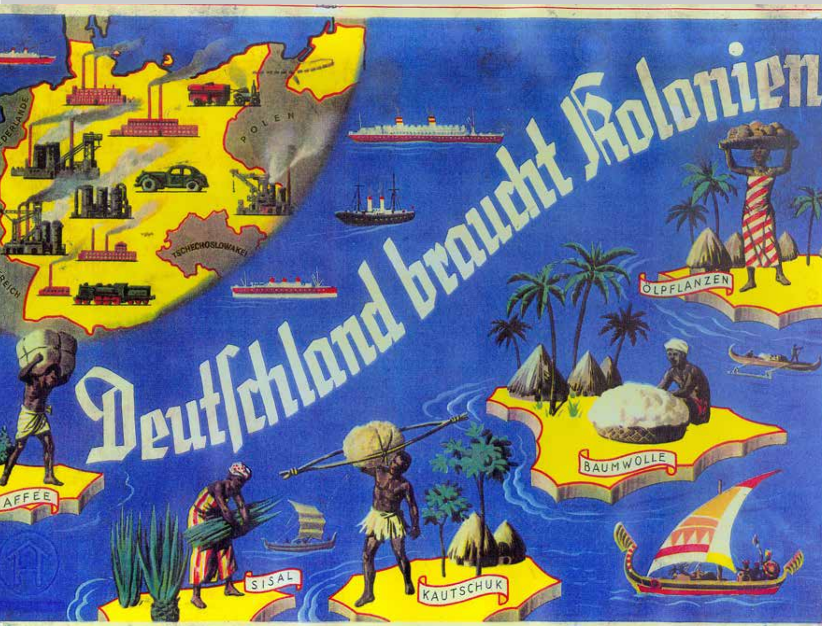
Deckel des Brettspiels „Deutschland braucht Kolonien“, 1938/39, © Sammlung Bechhaus-Gerst