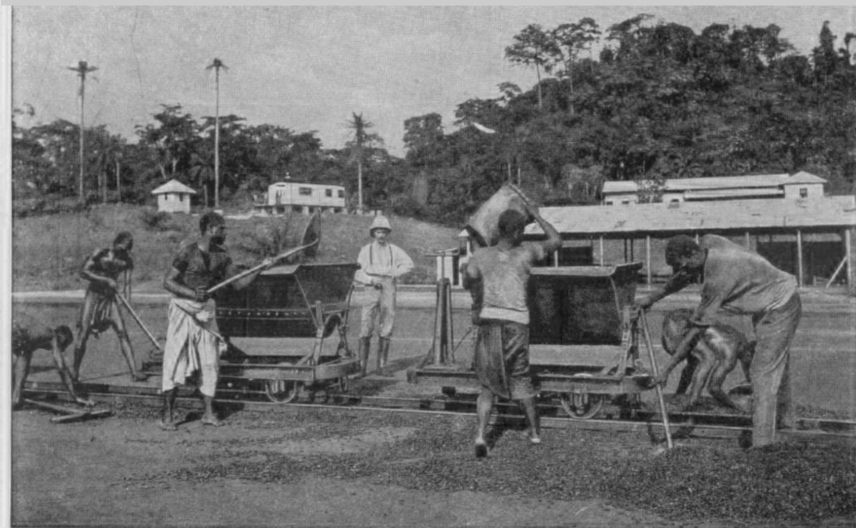
2. Westafrikanische Pflanzungs-Gesellschaft „Viktoria“, Kamerun. Transport der Kakaobohnen zur Trockenhalle.

Werbe-Postkarte der Westafrikanischen Pflanzungs-Gesellschaft „Viktoria“, © Sammlung Bechhaus-Gerst