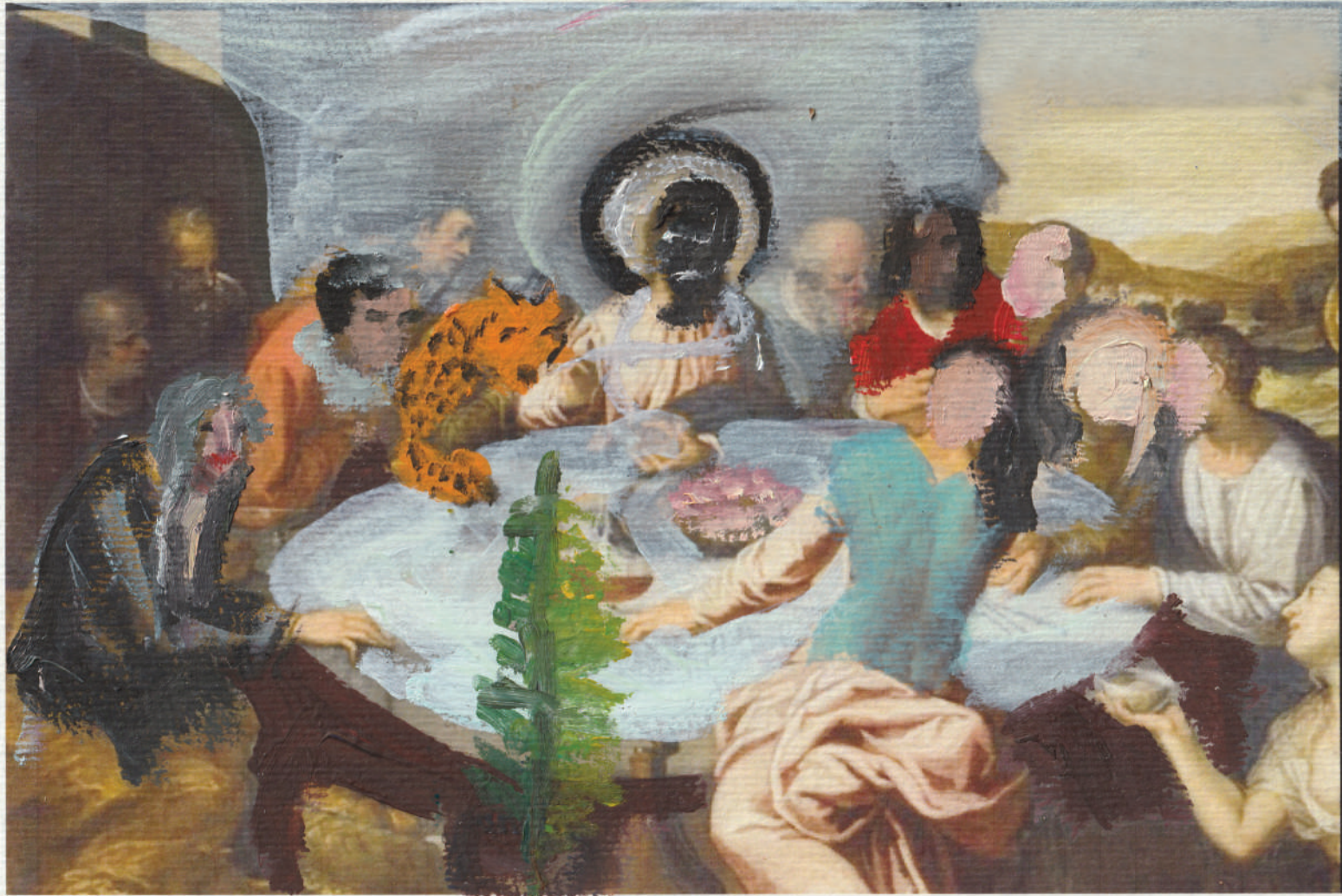
Nach Tintoretto, Übermalung (Farbskizze in Öl)