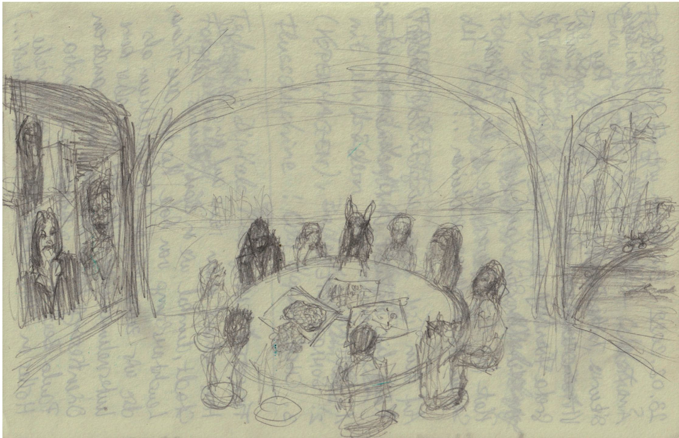
Prozess: Erste Tagebuchnotiz / Skizze